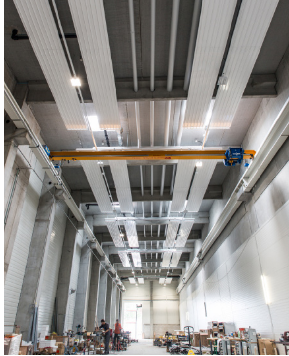
Liebherr Machines, Bulle Dampf-, Heizungs- und Kälteanlagen / Deckenstrahlplatten