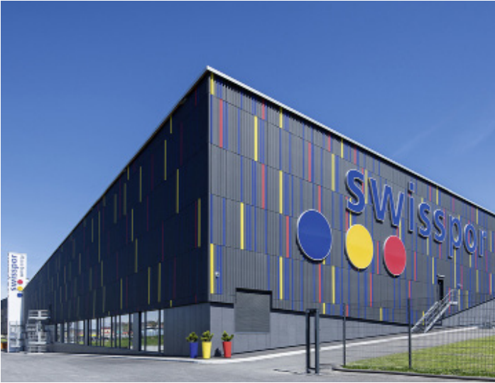
Swisspor I und II, Châtel-St-Denis Dampf- und Heizungsanlagen