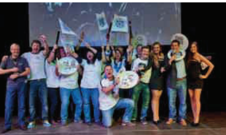
Best Fan Team: Die ZHT Lions der Zeindler Haustechnik AG.