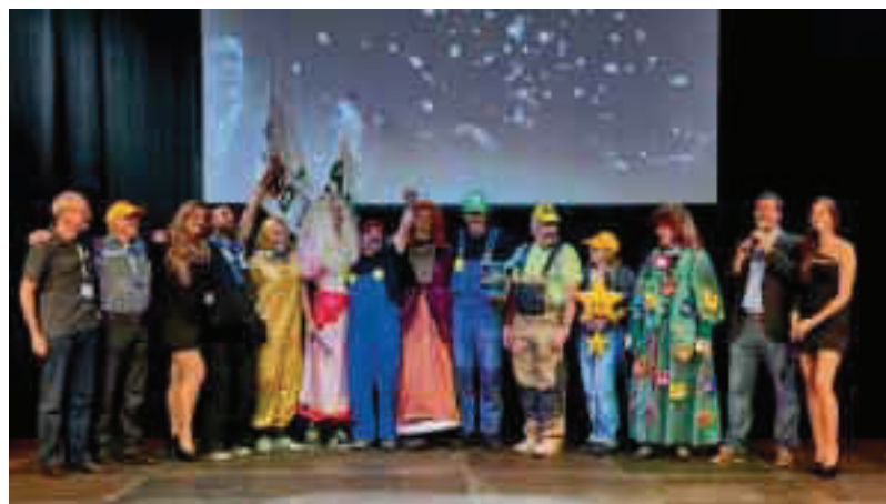
Das originellste Fan Team: Die Super Mario Bros der Rosenast Haustechnik AG.