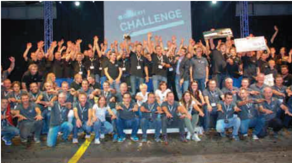
Die Teilnehmer sowie Helfer der Geberit Challenge feiern gemeinsam den gelungenen Event.

len Anlasses. Die Fans feuerten uns bei den schweisstreibenden Wettkämpfen an und trotz der Konkurrenz-situation war die Stimmung unter den Team-Mitgliedern super und fair. Auch wenn es für uns nicht in die Sie-gerränge gereicht hat, sind wir und unser Chef sehr stolz auf unsere Teilnahme und Leistung.» ■