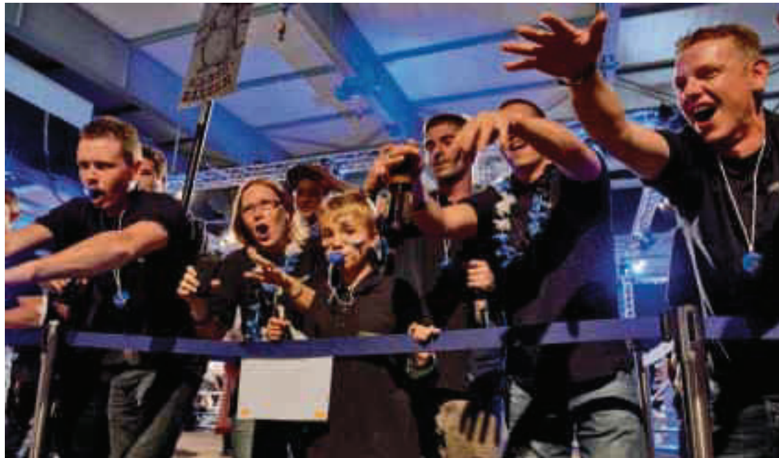
Die Fans unterstützten ihre Wettkampf-Teams lautstark und sorgten für eine ausgelassene Stimmung in der Wettkampfarena.